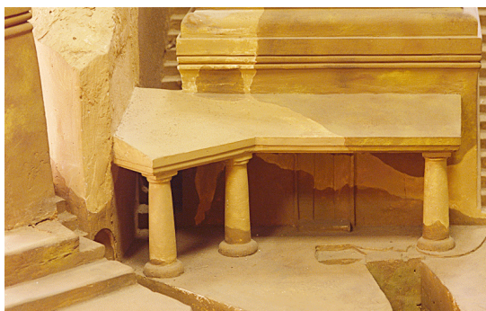
Museo delle Antichità Etrusche e Italiane dalle 20.00 alle 24.00